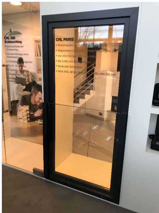
CRL_fensterbau_2.jpg Nahezu unsichtbar: das CRL PARIS System für französische Balkone fügt sich elegant an das Fensterprofil.